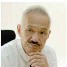
高松伸 (Shin Takamatsu)

建築家・京都大学教授。 1989年、40才にして日本建築学会賞を受賞。その後、芸術選奨文部大臣賞、国土庁長官賞、建築業協会賞(BCS賞)、公共建築賞など数々の賞を受賞。ドイツ・デュースブルグ市再開発、グルジア・リケ地区再開発などの国際設計競技にて最優秀賞を獲得し、海外でも活躍。 主な作品に、キリン本社ビル、ワコール本社ビル、天津博物館、国立劇場おきなわ、など。主な著書に、陽のかたち(筑摩書房)、王国(青幻舎)、夢のまにまに夢を見る(TOTO出版)、もうひとつの家(インデックスコミュニケーションズ)などがある。 アメリカ建築家協会名誉会員。ドイツ建築家協会名誉会員。英国王立建築家協会会員。